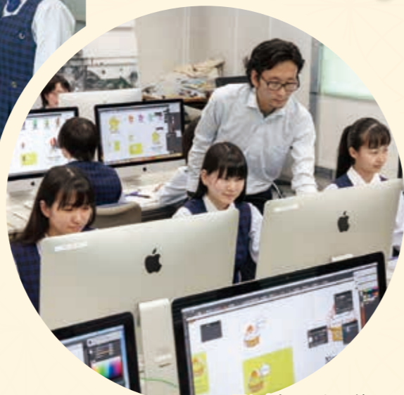
コンピュータを使った映像表現の学習も行っています。