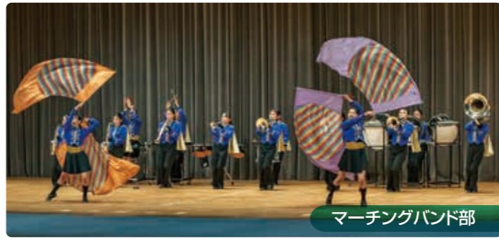
マーチングバンド部