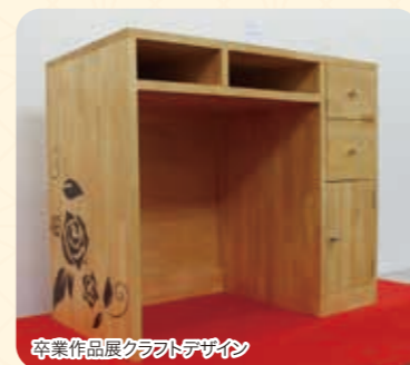
卒業作品展クラフトデザイン