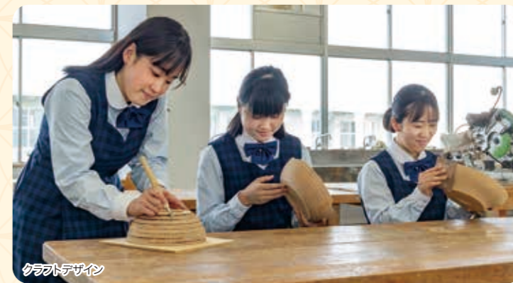
クラフトデザイン