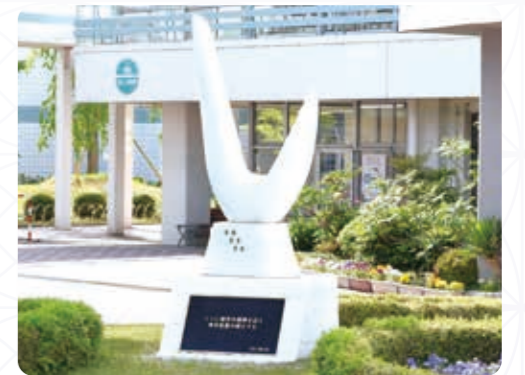
【学園シンボル「めばえ」】

学園の歴史と伝統から、新しい時代に向けた学園教育が芽を出して花を咲かせるようにとの想いが込められています