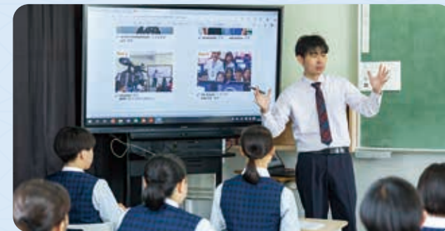
全教室に電子黒板・Wi-Fiを完備!

全教室に電子黒板とPC端末があり、Wi-Fiも自由に使用できます。本校ではこれらを授業や探究活動に活用し、生徒の深い学びにつなげています。また、学習面では実績のある「スタディサプリ」、探究活動では気鋭の「ENAGEED」を採用することで、多様な視点での学習を可能にしています。